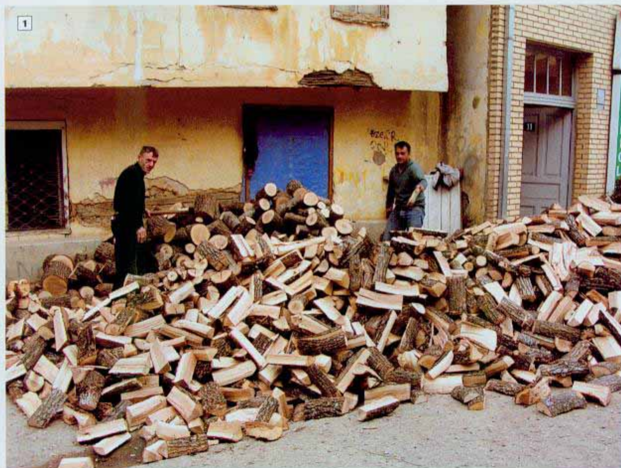
1. תנאי מזג האוויר בחבל קוסובו, בהשוואה למדינות המקיפות אותו, נוחים יחסית, אך החורפים קשים ותושבי המקום מכינים גזעי עצים להסקה ולחימום.

בשנת 1953 איחד הנשיא טיטו את העמים הסלביים בדרום אירופה: סלובניה, קרואטיה, בוסניה-הרצגובינה, סרביה, מונטנגרו ומקדוניה, וכן את חבלי הארץ קוסובו וודגוודינה. מטרתו הייתה ליצור יוגוסלביה אחת נדולה, אבל כבר אז הוא הבין שבחבל קוסובו קרוב ל-90 אחוז