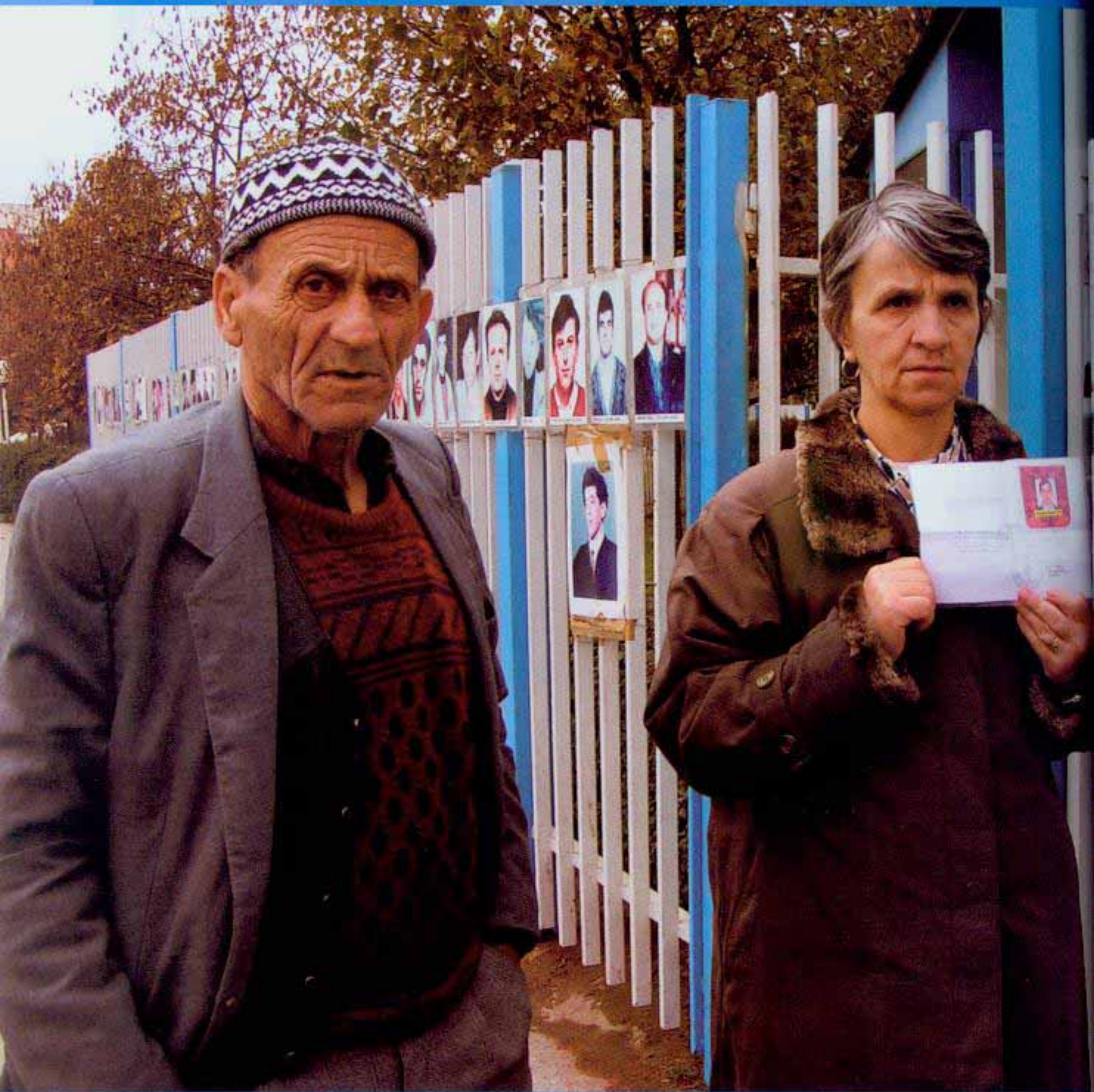
חיים לילד שנעדר מתקופת מלחמת קוסובו. האבדן והאבדן מקבלים משמעות הרבה יותר מוחשיית כשפוגשים בבני משפחה חוצאים על גדות. הפרלמנט בתקווה לקבל תשובות ומידע על קרוביהם הנעדרים.