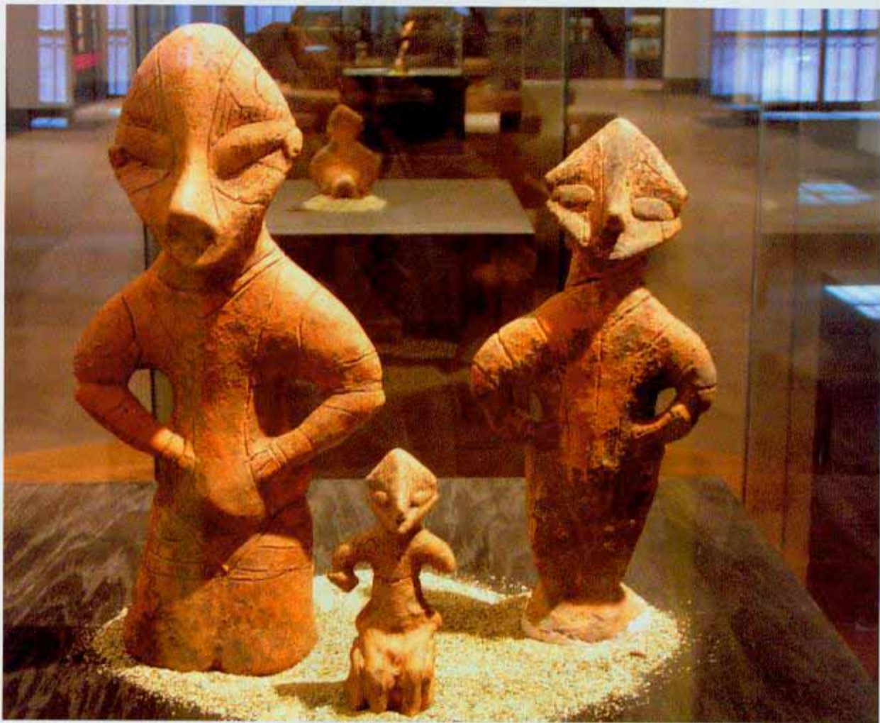
פסלי האלילים מוצגים דרך קבע בתערוכה במוזיאון המקומי לאמנות בעיר פרישטינה. עד היום נחגלו שבעה פסלים מעין אלה בחפירות באזור. אוצרי התערוכה סבורים כי קיימים עוד רבים מהם. אחד הפסלים משמש סמלה של העיר פרישטינה.

עצמו את מלאכת משרד התיירות של קוסובו, במטרה להציג למבקרים שיש בשורה במקום היילא כל כך פופולרי זה. בפרישטינה, הנמצאת בתנופת בנייה, שכונות שלמות נושאות עדיין את צבע אבני הטרקוטה החומות, חלקו כנראה יישארו כך, אחרות, לפי המראה הכללי, יקבלו כנראה בליל עונים אחרים, מוזרים ותלושים מעט מהמצופה, אבל בהחלט מעניינים לעין. סרובות מסתובבים אלפי כלי רכב ושוטרים מטעם האו"ם, שבשפת המקום קרויים United Nation Mission in UNMIK (Kosovo). כתגובת נוסף להם יש שוטרים מקומיים, וצבא חיילים של נאט"ו - כל הכוחות הללו מוצבים בכל רחבי קוסובו.